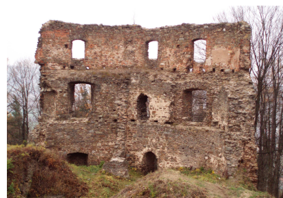
HRAD CIMBURK z období okolo roku 1200

Pro zájemce o tento kříž – z Městečka Trnávka po silnici 2 km ve směru na Vranovou Lhotu a Bouzov