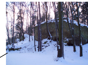
RADKOVSKÉ HRADISKO z období cca 11.stol.