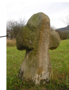
Kříž ev. č. 3245 s reliéfem oje povozu